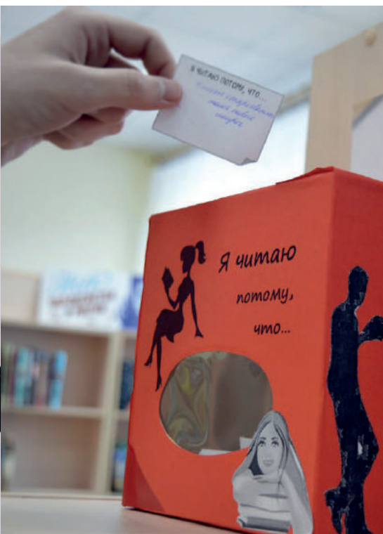
Мероприятия в библиотеке всегда дают мотивацию к чтению