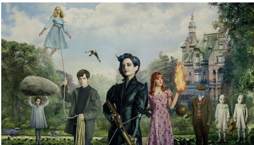
Кадр из фильма «Дом странных детей мисс Перегрин» Тима Бертона

«Если бы я мог, я сидел бы и читал все время» – с этими словами американского писателя Дэниела Киза наверняка согласится весь читающий мир. Как же хочется иногда остаться дома и провести вечер за чтением любимой книги с чашкой горячего какао! Мы предлагаем вам открыть для себя несколько удивительных книг, которые лично на нас произвели неизгладимое впечатление.