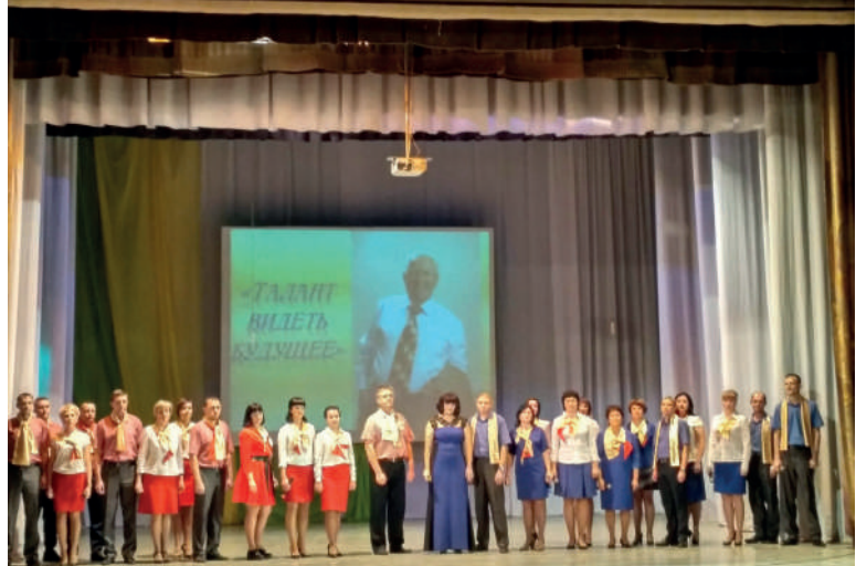
На благотворительном концерте «Талант видеть будущее»